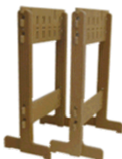
Die Systemböcke SB 1000