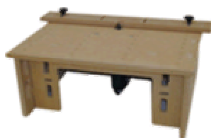
Der Modultisch PMT 1000

Der perfekte Einstieg in unser Modulsystem – für Sie schon fertig zusammengestellt!